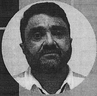
DISPACELLI BRASIL Assessor Técnico da AMC