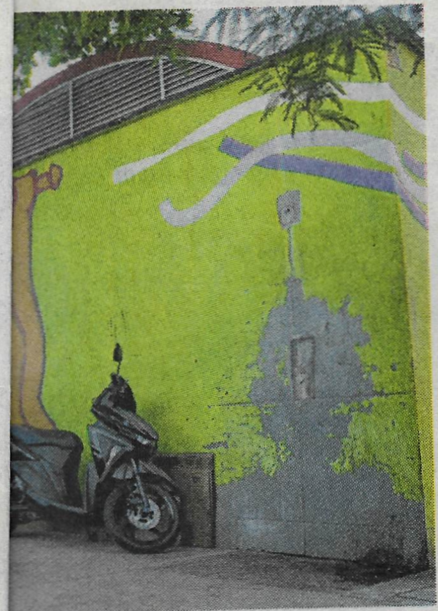
CHUVEIRO QUEBRADO serve de estacionamento

mais eira- dos izados no antes aos banhistas