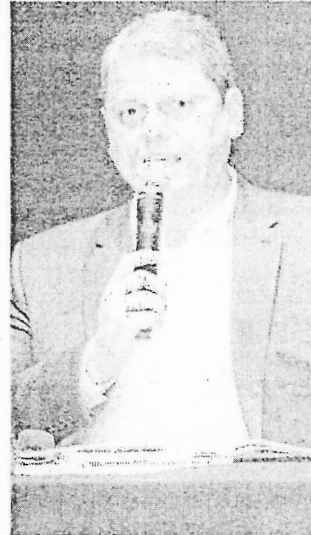
TARCÍSIO de Freitas é cotado para disputar a Presidência em 2026